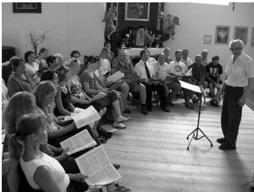
Ze zkoušek 2010