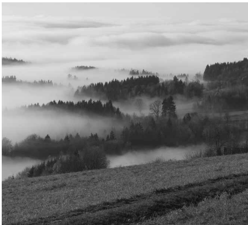
Podzimní pasecké stráně