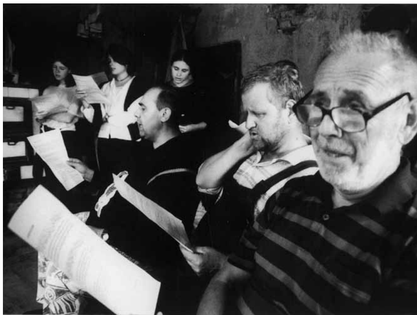
Zkouška sborových částí ke hře Zapadlí vlastenci (2002)