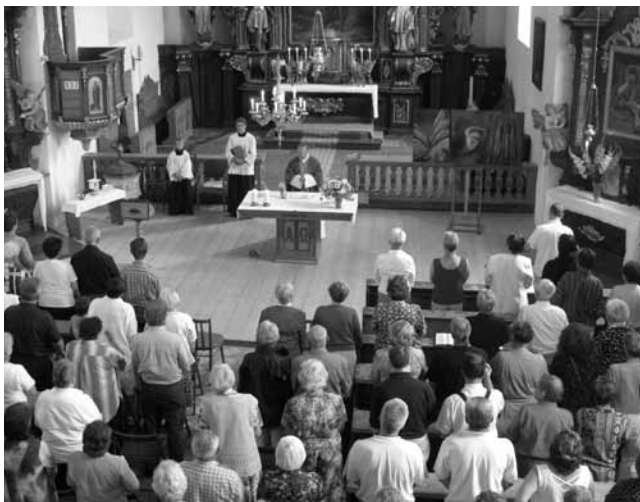
Pasecké hudební slavnosti (2009)