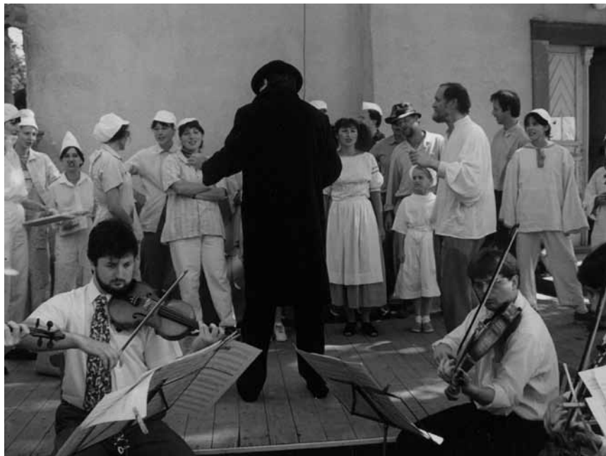
F. X. Thuri: opera Španilá pastýřka (1999)