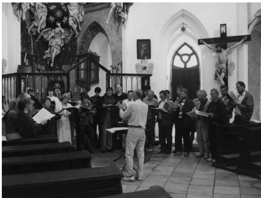
Koncert v kostele sv. Jana Nepomuckého na Zelené Hoře (1995)