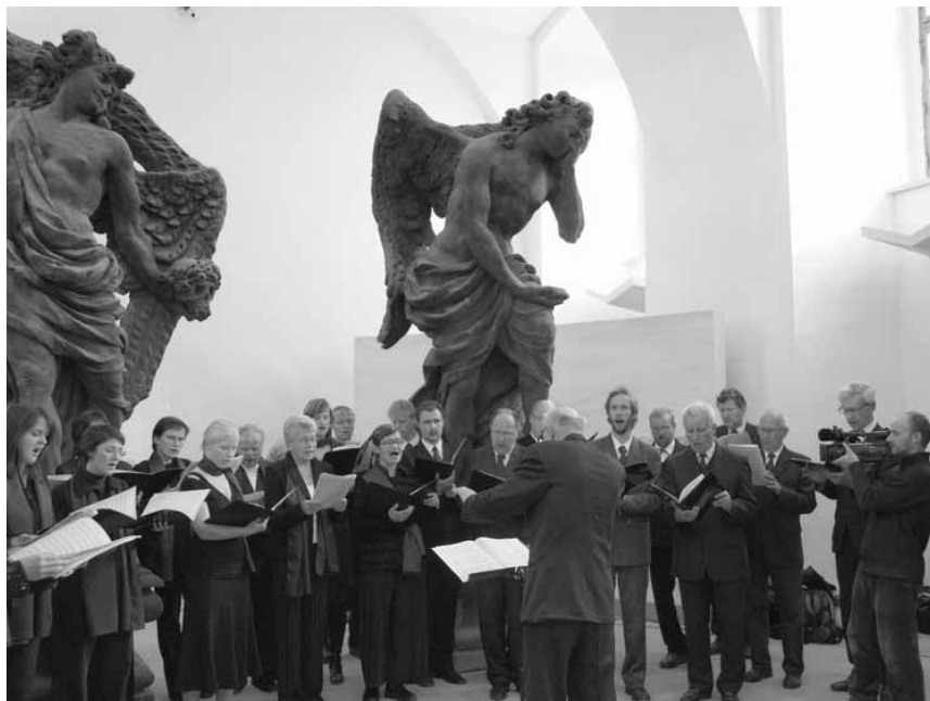
Výstupení na Kuksu (2008)