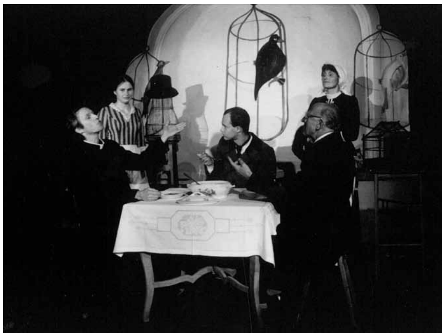
Zapadli vlastenci (2002)