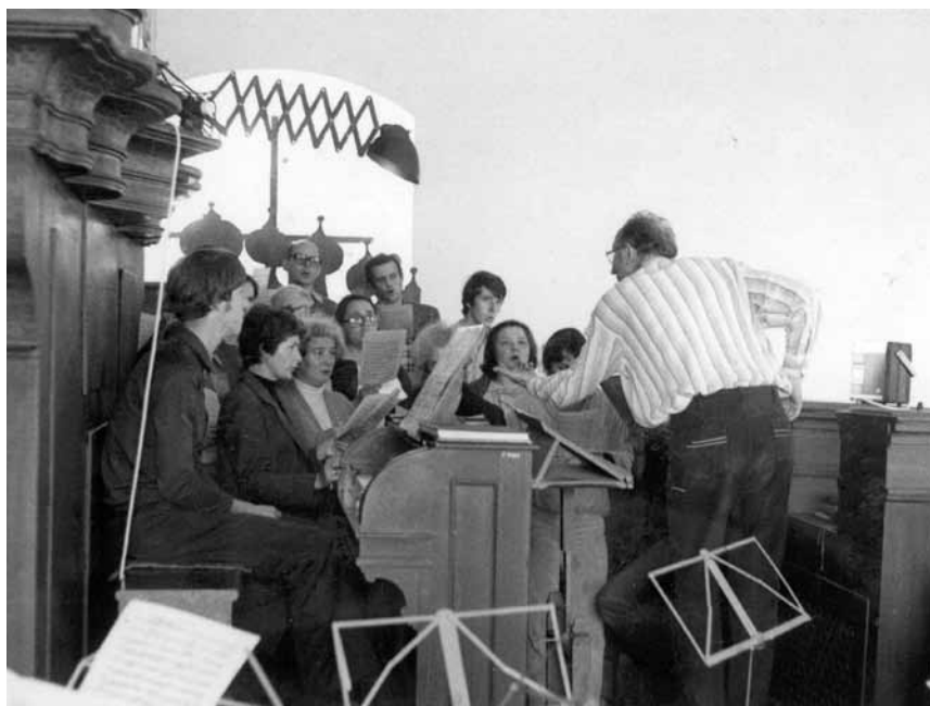
Svatováclavský sbor 28. prosince 1980