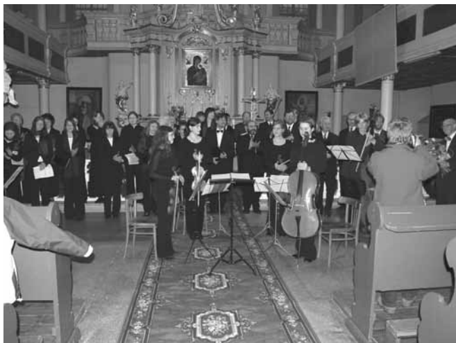
Svatováclavský sbor v Polsku (2008)