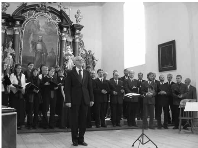
Sborový koncert (2005)