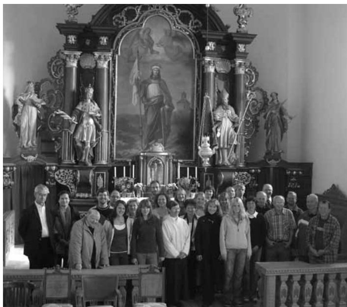
Svatováclavský sbor 2010