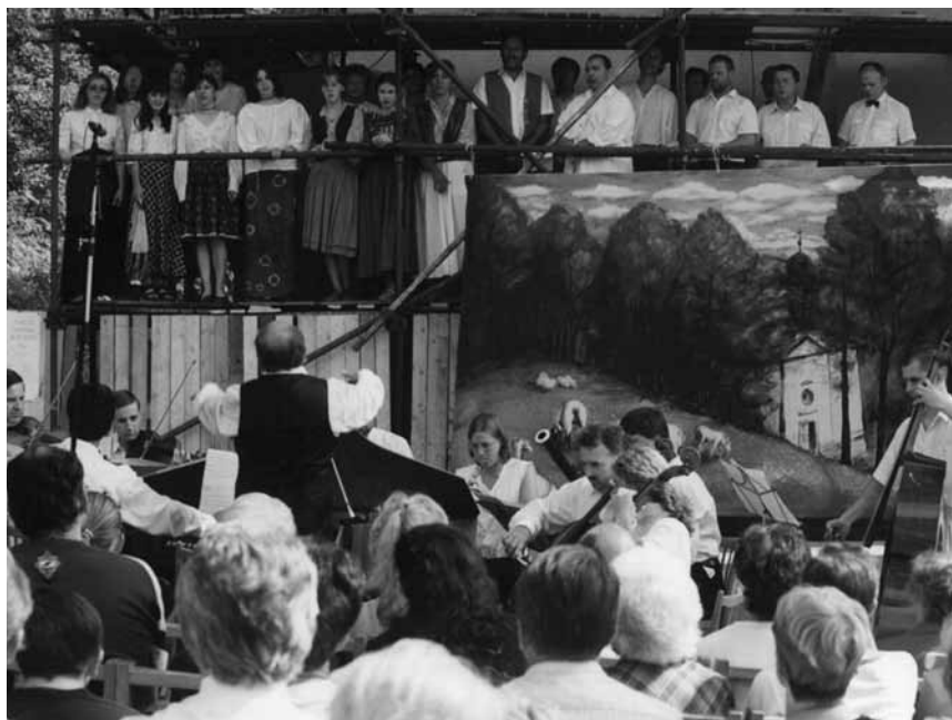
K. Loos: Opera o kominku zedníky nakřivo postaveném (1997)