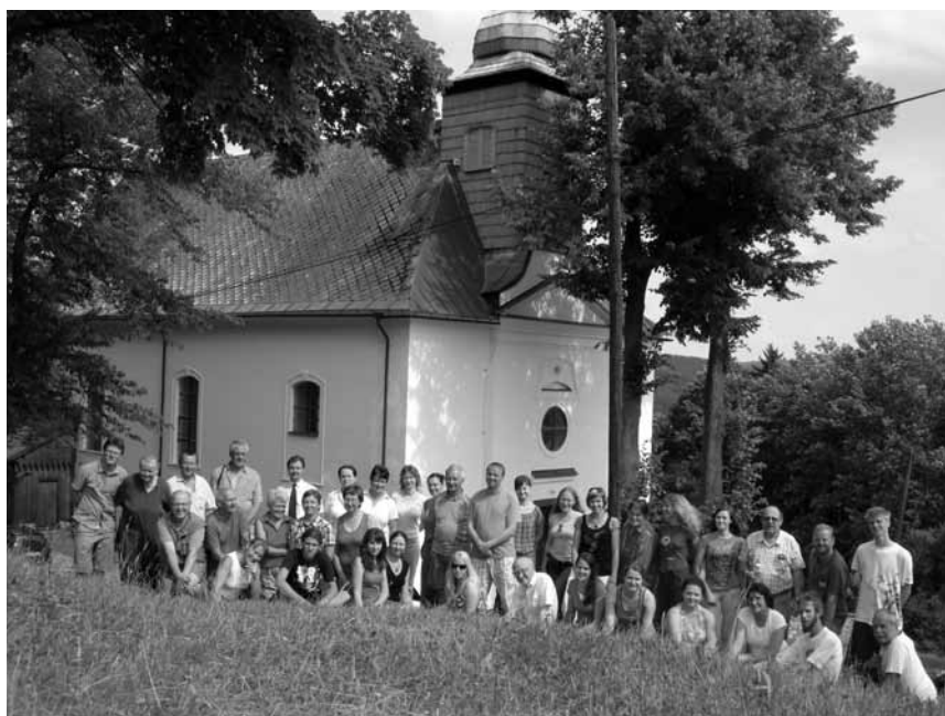
Svatováclavský sbor 2010